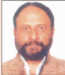
श्री केतन मेहता निदेशक (24 जून 2011 तक) Shri Ketan Mehta Director (Upto 24th June 2011)