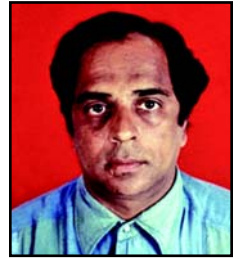
श्री पहलाज निहलानी निदेशक (27 अगस्त, 2005 तक) Shri Pahlaj Nihalani Director (Upto 27th August, 2005)