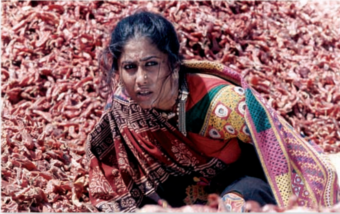
◀ Mirch Masala